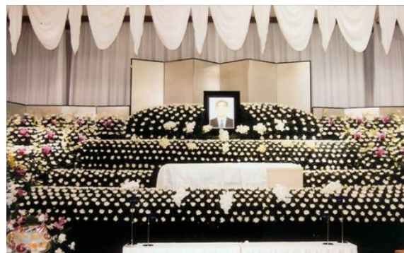
花と音楽でいっぱいの葬儀