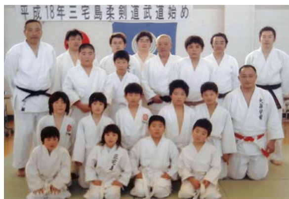
「平成18年三宅島柔剣道武道始め」より

帰島後も、火山ガスの影響により、室外の活動には制限がありますが、一日も早く災害前の活発なスポーツ活動が実施されるよう、体育指導委員（島内5地区、10名）も活動を行っています。今年度は全島あがてのイベントは行われませんでした。来年度はいろいろなスポーツイベントを開催したいと考えています。